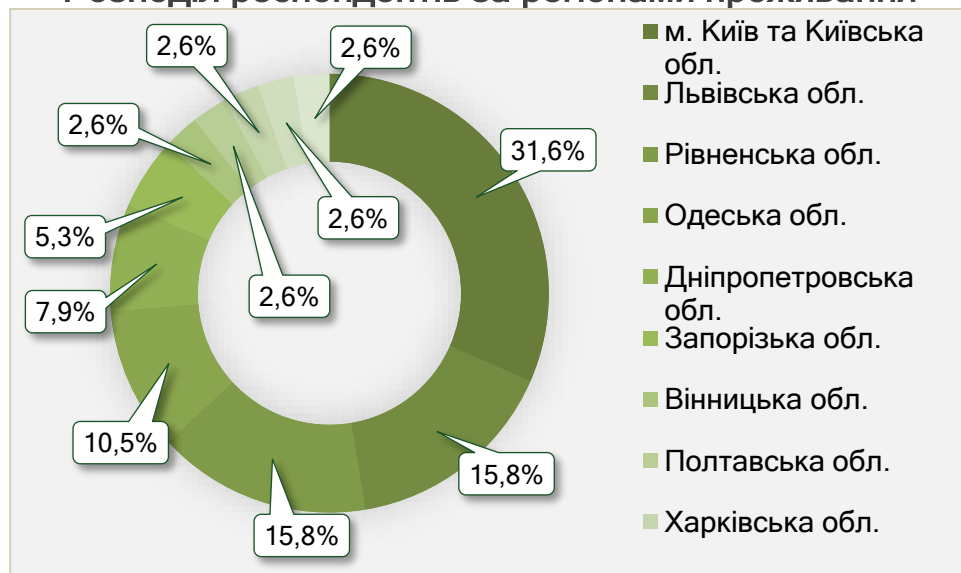
Розподіл респондентів за регіонами проживання