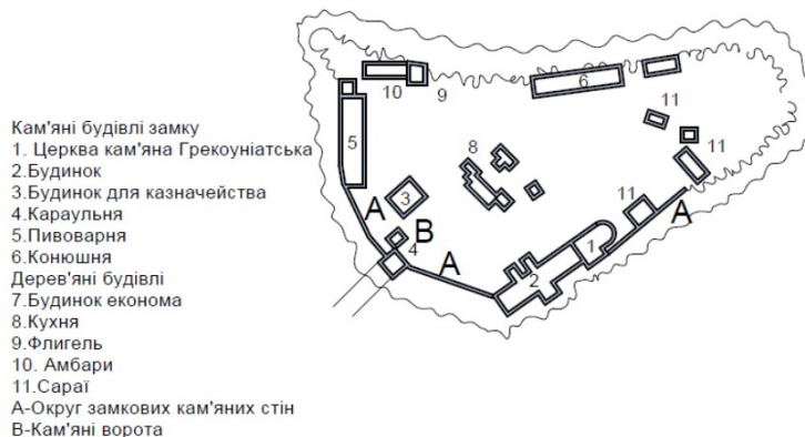
Рис. 2. Схема забудови замку Острозьких станом на кінець XVIII ст. (схема автора на основі плану 1794р)

церква хатня, камінна, крита дахівкою. За церквою частина камінної стіни тягнеться до середини замка; під стіною вихідня для води... До замка веде дерев'яний міст на камінних биках... Замок побудовано з дерева дубового в зруб, — у три стіни, обмазані глиною. В брамі до замка ворота подвійні. В середині замка порожні кухні... В замку сторожок 63, під ними комор порожніх, що місцями обвалились, 72. На одному з бастіонів від камінного палацу є годинник пошкоджений... За замком — стайня-маштарня і біля них — світлиця й комора. Біля замка — від валу міського — шматок камінної стіни з вихіднею для води; друга вихідня камінна міститься в валі від річки Ікопоті; в ній ґрати дерев'яні.» [9]. Інший інвентар з 1636 року засвідчує, що досить розвинена замкова інфраструктура вже потребувала ремонту. На той час на замковому терені розташовувалися: потужна в'їзна брама, великий дерев'яний будинок із залом на партері на п'ятнадцять вікон і мурований арсенал [8].