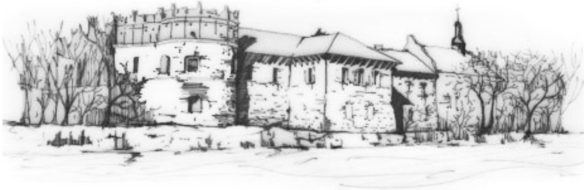
Рис. 3. Замок Острозьких в Старокостянтинові. Рисунок автора

Основна замкова споруда становить видовжену в плані будівлю, розташовану майже впритул до південної берегової лінії [6] (рис. 3).