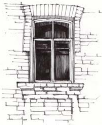
Рис. 2. Вікно з лучковою перемичкою (с. Гільча Друга) Прорис по фото І. Омельчук

а) с. Гільча Друга, вул. Першотравнева, буд.56а; б) с. Гільча Друга, вул. Першотравнева, буд.65а; в) с. Урвенна вул. Жовтнева буд. 50; г) с. Гільча Друга, вул. Першотравнева, буд. 75. Прорис по фото І. Омельчук